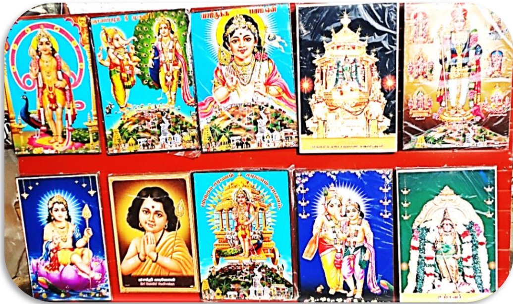
Bildnisse von Skanda, wie Er heute dargestellt wird